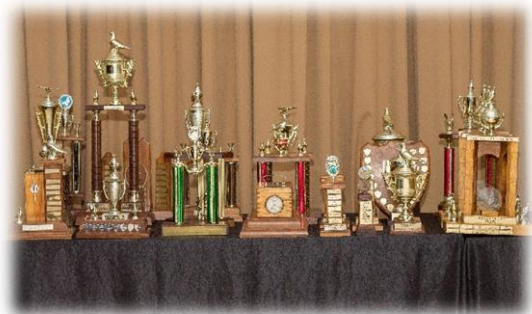
Van die pragtige trofees wat uitgedeel is