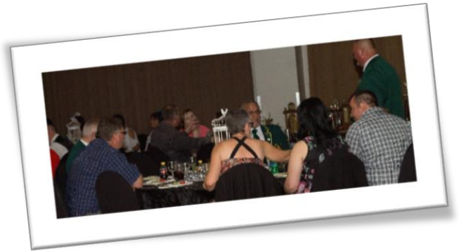
Gaste besig om te smul aan die heerlike 3 gang maaltyd wat voorgesit is!