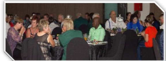
Gaste kuier lekker gesellig. Die opkoms was baie goed gewees!