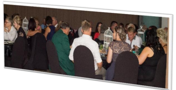
Die ProFlight tafel was lekker jolig tot laataand!